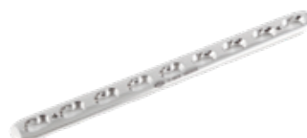
Placa Estrecha Bloqueada 848 4 a 12/14/16 Orificios