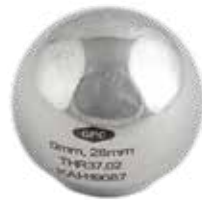
Prótesis Cabeza Intercambiable

THR37 28 mm - Corta -3 - Mediana -0 - Larga +3