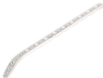
Placa Húmero Distal Lat - DER 929 5/7/9/ 11/13/15 Orificios - DER