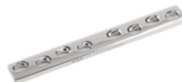
Placa Ancha (DCP) 619 7 a 10/12 Orificios