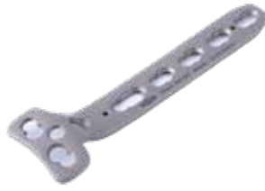
Placa "T" c/Soporte Bloq. 855T 3 a 11 Orificios