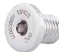
Tapón Clavo Supra Condylar ECIN