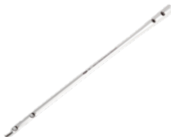
Clavo Supra Condylar IMN 9/10/11/12 - 150 a 400 mm