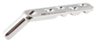
Placa DHS 135° Bloqueada 866 4 a 13 Orificios