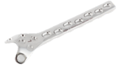
Placa de Condilar Sustentación 815 7 y 9 Orificios - IZQ/DER