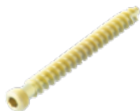
Tornillo Esponjoso 6.5mm Cab./Ros.