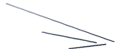
Barra Fibra de Carbono 4.0 mm