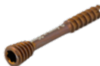
Tornillo Canulado Herbert 2.4mm Titanium