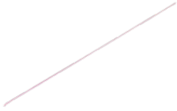
Haste Fin (Flexible Nail) TNI02T 2 a 4 x 440 mm