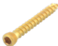
Tornillo Esponjoso 3.5mm Cab./Ros.