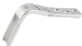
Placa Angulada 95° 605 5/7/9/12 Orificios - Hoja 50/60/70/80