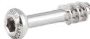
Tornillo Esponjoso 4mm Rosca Parcial