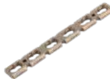
Placa Reconstrucción 920T 4 a 10/12/14 Orificios