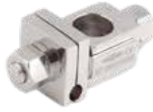
Abrazadera Ajustable Simple Fijador Externo