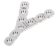
Placa de Reconstrucción "Y" 636 6/9/12 Orificios