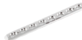
Placa Estrecha Bloqueada 845 5 a 14 Orificios