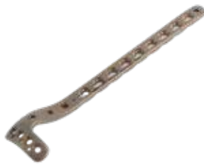
Placa Tibia Proximal 906T 4/6/8/10/12/14 Orificios - IZQ/DER