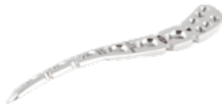
Placa Clavicula Superior Ant. Lateral Externo