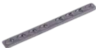
Placa Estrecha DCP 618T 6 a 10/12 Orificios