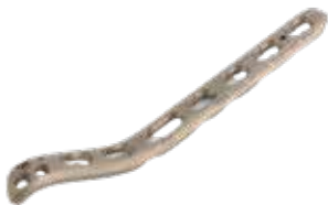
Placa Medial Humeral 927T 3/5/7/9/11/14 Orificios - IZQ/DER