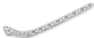
Placa Tibial Proximal Bloqueada (Hockey) 840 4/6/8/10/12/14/16 Orificios - IZQ/DER