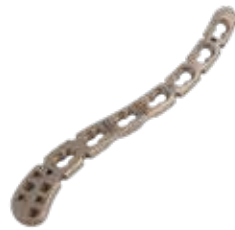
Placa Clavícula Ant. Lat. 921T 6 a 8 Orificios - IZQ/DER