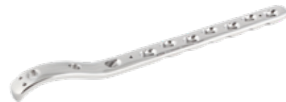
Placa Fémur Proximal Bloqueada 856 5/7/9/11/13/15 Orificios - IZQ/DER