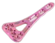
Placa Radio Distal A/V 925T 3 a 7 Orificios