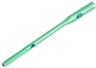
Clavo Femoral Proximal IntraHEAL ADV PFAT 9/10/11 - 170/200/240 mm