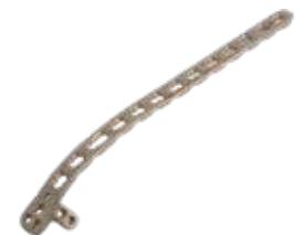
Placa Dorsolateral c/sop 915T 3/5/7/9/11/13 Orificios - IZQ/DER