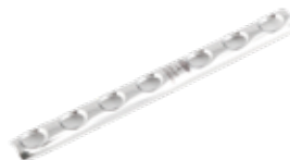
Placa Tubular 1/3 639 2 a 12 Orificios