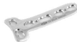
Placa "T" Bloqueada - 2 850 2 x 4 a 8 Orificios