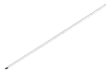
Alambre Roscado Parcial-Total Kirschner