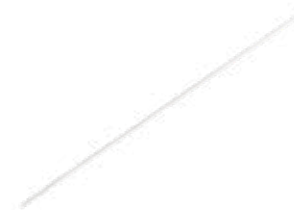
Alambre Guía Roscado Central Steinmann