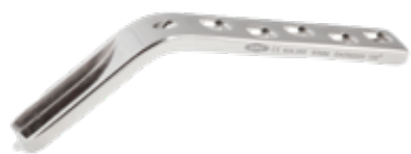
Placa Angulada 130° 604 5/7/9/12 Orificios - Hoja 50/60/70/80