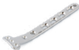
Placa Tibial Proximal Medial 935 4 a 16 Orificios - IZQ/DER