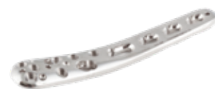
Placa Tibia Distal Medial Bloqueada 934 4/6/8/10 Orificios IZQ/DER