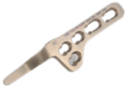
Placa Clavícula Gancho 903T 4 y 5 Orificios - Gancho 12/15/18 mm