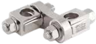
Junta Universal (Recto - Curvo)