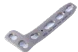
Placa "L" c/Soport Bloq. 850T 3 a 11 Orificios - IZQ/DER