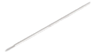
Clavo de Schanz