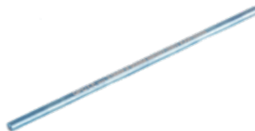
Barra 3mm MAS27.3T 50/60/70/90 mm