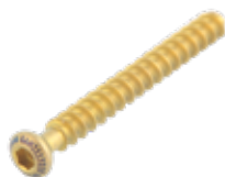
Tornillo Esponjoso 4mm (Rosca Total)