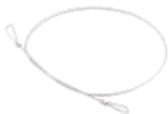
Alambre GIGLI Fino