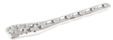
Placa Philos Bloqueada