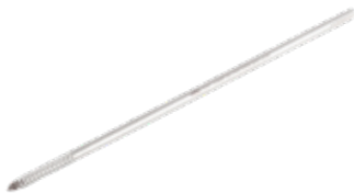
Barra Pequeña de Conexión