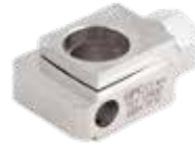
Abrazadera de Conexión Fijador Externo