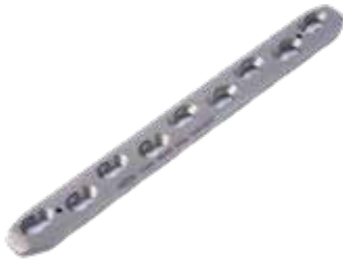
Placa Ancha Bloq. 849T 6 a 12/14 y 16 Orificios