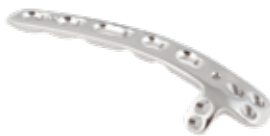
Placa Humero Distal Dorsolateral c/Soporte