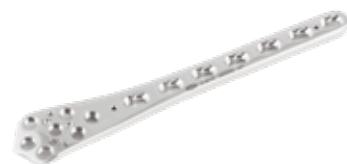
Placa Fémur Distal Bloqueada 851 5 a 13 Orificios - IZQ/DER