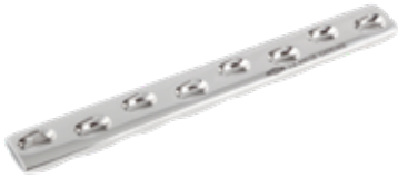
Placa Ancha LC-DCP 630 6 a 11 Orificios