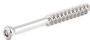
Tornillo Esponjoso 6.5mm Rosca 32