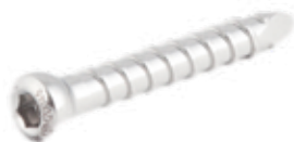
Perno de Bloqueo 3.9mm ILB39 24 a 50 mm [pares]