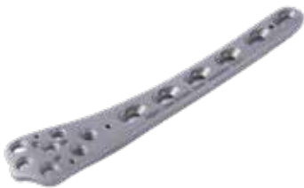
Placa Distal Femoral 851T 5 a 13 Orificios - IZQ/DER