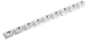
Placa de Reconstrucción 634 6 a 10/12 Orificios