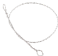
Alambre GIGLI Ordinario