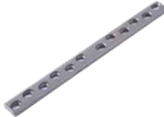
Placa Ancha DCP 819T 7/8/9/10/12 Orificios