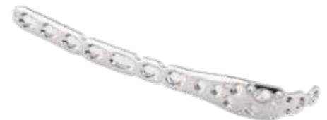
Placa Olecranon Bloqueada