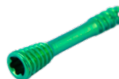
Tornillo Canulado Herbert 3.0mm Titanium