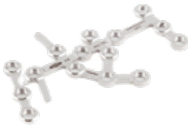
Placa Calcaneo Bloqueada