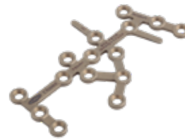
Placa Calcaneo 902T 69 y 76 mm Orificios - IZQ/DER