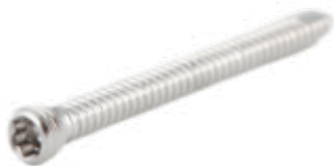
Tornillo Fijación 2.4mm Cabeza Estrella