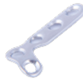
Placa en "L" Oblicua Ø 2.7mm 672 2 X 3 Orificios - IZQ/DER