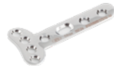
Placa "T" - 4 642 4 x 3 a 6 Orificios