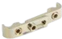
Cross Link Montado MAS26T Pequeño, Mediano y Grande