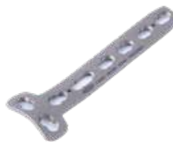
Placa "T" Bloq. 850T 4 a 8 Orificios