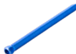
Tornillo Fijación 5mm

765T 10 a 60 [pares] /65/07/75/80 mm - RT