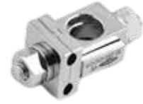
Abrazadera Ajustable Doble Fijador Externo