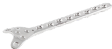
Placa Condilar Sustentación Bloqueada 841 6/8/10/12 Orificios - IZQ/DER