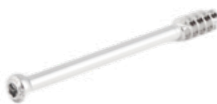
Tornillo Esponjoso Canulado 7mm Rosca 16