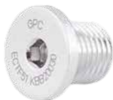
Tapón Tibial-Femoral ECTF