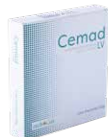
Low Viscosity Bone Cement