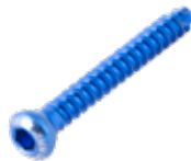
Tornillo Cortical 4.5mm Autorroscable

736T 14 a 60 [pares] /65/70/75/80/85/90 RT