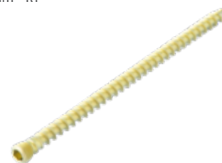
Tornillo Esponjoso 5.0mm Cab./Ros.