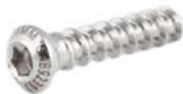
Tornillo Esponjoso 3.5mm Rosca Total