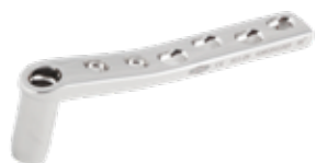
Placa Tubo 95° DCS (AO) 611 6 a 10/12/14/16 Orificios