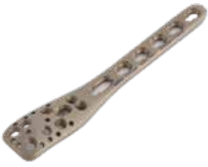
Placa Philos Bloqueada 938T 3 a 12 Orificios