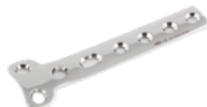
Placa "T" - 2 644 4 a 10 Orificios