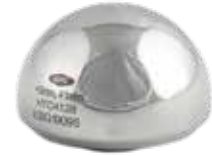
Prótesis Cadera Bipolar