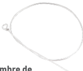
Alambre de Cerclaje Loop