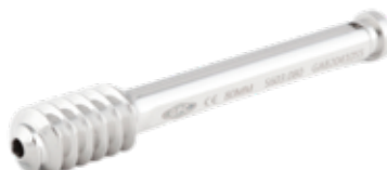
Tornillo Deslizante DHS Tipo A0