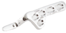
Placa Clavicula c/Gancho Bloqueada