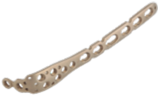
Placa Olecranon Bloq. 903T 3 a 10/12 Orificios - IZQ/DER