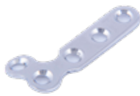
Placa en "L" Ø 2.7mm 672 2 X 3 Orificios - IZQ/DER