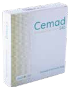
Std Viscosity Bone Cement