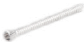
Tornillo Fijación 5mm Cabeza Roscada