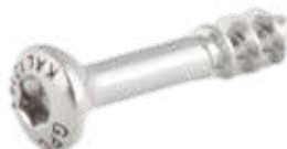
Tornillo Esponjoso 3.5mm Rosca Parcial