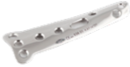
Placa Cuchara 638 5 y 6 Orificios