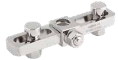
Abrazadera Transversal Fijador Externo