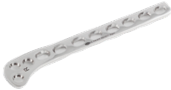
Placa Sustentación (Hockey) LC-DCP Tibial 819 5/7/9/11/13 Orificios IZQ - 5 y 7 Orificios DER