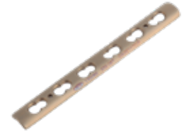
Placa Tubular 939T 4 a 12 Orificios