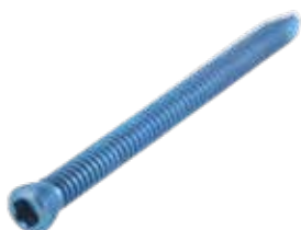
Tornillo Fijación 3.5mm Cab./Ros.

765T 10 a 60 [pares] /65/07/75/80 mm - RT