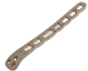
Placa Dorsolateral 905T 3/5/7/9/14 Orificios - IZQ/DER