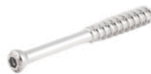
Tornillo Esponjoso Canulado 7mm Rosca 32