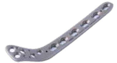
Placa Tibial Proximal Bloq. 840T 4/6/8/10/12/14/16 Orificios - IZQ/DER