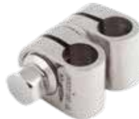
Junta Universal (Tubo - Tubo)