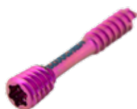
Tornillo Canulado Herbert 2.0mm Titanium