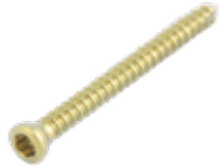
Tornillo Cortical 2.4mm (Estrella)