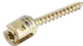
Tornillo Poliaxial MAS44T 4/5/6/7 - 25 a 50 mm