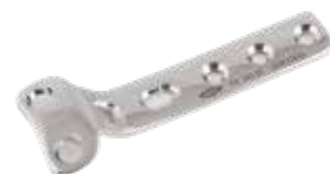
Placa "T" de Sustentación - 2 645 4 a 10 Orificios