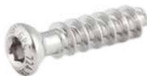
Tornillo Esponjoso 4mm Rosca Total