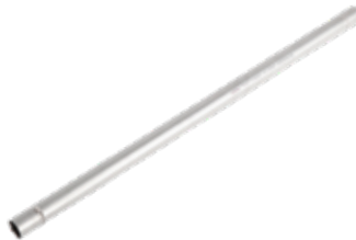
Tubo Acero Inoxidable

TEF 1290H - 100 - 300mm - Fijación Externa