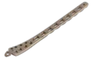
Placa Distal Tibial Bloq. 867T 4/6/8/10/12/14 Orificios - IZQ/DER