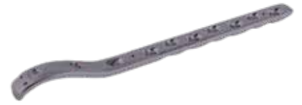
Placa Fémur Proximal Bloq. 856T 5/7/9/11/13/15 Orificios - IZQ/DER