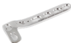
Placa "L" c/Soporte Bloqueada 858 3 a 11 Orificios - IZQ/DER