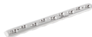
Placa Ancha Bloqueada 849 6 a 12/14/16 Orificios