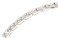
Placa Reconstrucción Bloqueada Curva 920C 4 a 10 Orificios