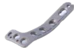
Placa Tibial Proximal 928T 4/6/8/10/12/14/16 Orificios - IZQ/DER