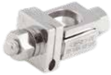
Abrazadera Abierta Fijador Externo