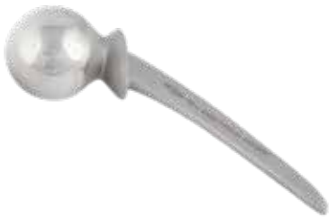
Prótesis Cadera Thompson