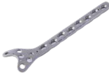
Placa Condilar Susten. 841T 6/8/10/12 Orificios - IZQ/DER