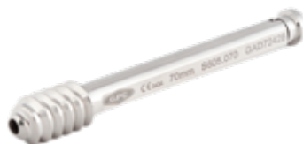
Tornillo Deslizante Pediátrico