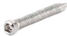
Tornillo Fijación 2.7mm Cabeza Roscada