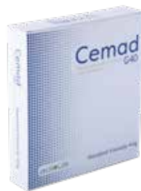
Std Viscosity Bone Cement w/Gentamicin