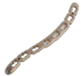
Placa Clavícula "S" 933T 3 a 12 Orificios