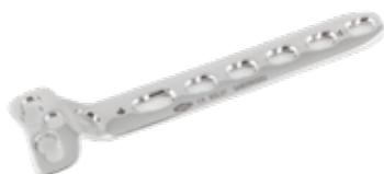
Placa "T" c/Soporte Bloqueada - 2 855 2 x 3 a 11 Orificios