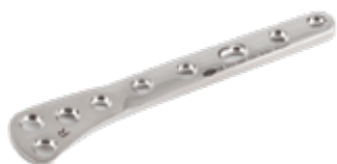
Placa Tibial Distal 652 5 Orificios IZQ - 5 a 12 Orificios DER