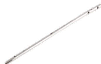
Clavo Humeral Canulado HNC 6/7/8 - 180 A 300 mm