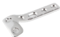
Placa en "L" 624 4 a 7 Orificios IZQ/DER