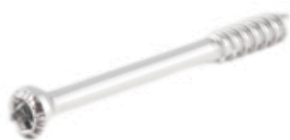
Tornillo Esponjoso Canulado 4.5mm Rosca Parcial