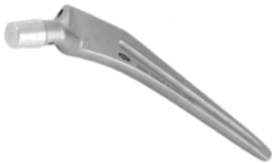
Prótesis Cadera Muller