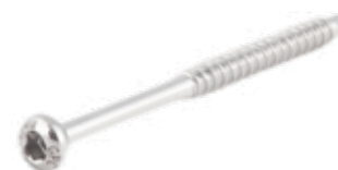
Tornillo Maleolar 4.5mm Rosca Parcial