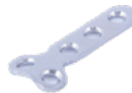
Placa en "T" Ø 2.7mm 672 2 X 3 Orificios