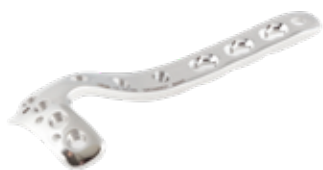
Placa Tibia Proximal 906 4/6/8/10/12/14 Orificios - IZQ/DER