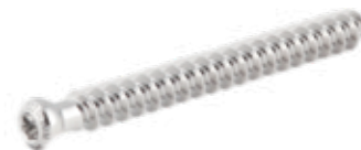
Tornillo Esponjoso 6.5mm Rosca Total