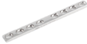
Placa Estrecha (DCP) 618 6 a 10/12 Orificios