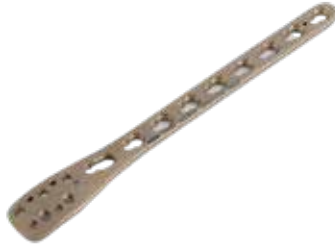
Placa Peroné Distal 942T 3/5/7/9/11 Orificios - IZQ/DER