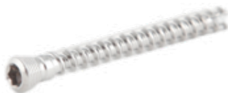
Tornillo Fijación Esponjoso 5mm Cabeza Roscada