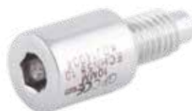
Tapón Clavo Humeral ECHN 0/5/10/15 mm