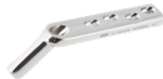
Placa Tubo 135° DHS (AO) 610 3 a 10/12/14/16 Orificios