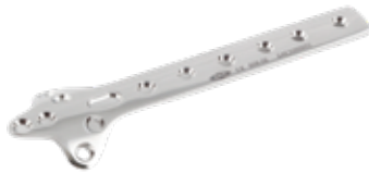
Placa Trebolar 608 3 a 6/8/10/12 Orificios