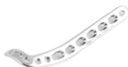
Placa Tibia Distal Antero Lateral 936 6/8/10/12 Orificios - IZQ/DER