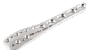
Placa Peroné Lateral 942 3/5/7/9/11 Orificios - IZQ/DER