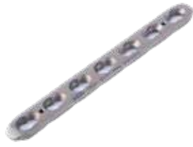
Placa Estrecha Bloq. 848T 4 a 12/14 y 16 Orificios