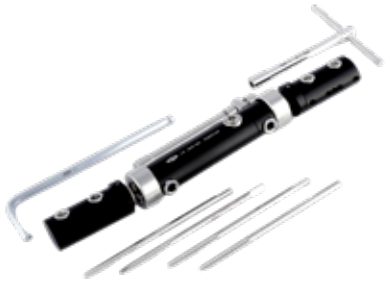
Fijador Externo Dinámico (Húmero - Tibia - Fémur)