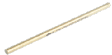
Barra 5.5mm MAS27.5T 40 a 400 mm