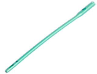
Clavo Femoral Proximal Largo IntraHEAL ADV LPFAT 9/10/11 - 340 a 420 mm - IZQ/DER