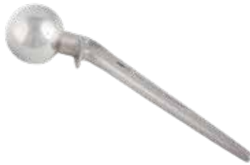
Prótesis Cadera Lazcano