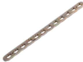
Placa Estrecha Bloqueada 845T 5 a 14 Orificios