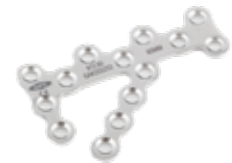
Placa de Calcaneo 812 60 y 70 mm