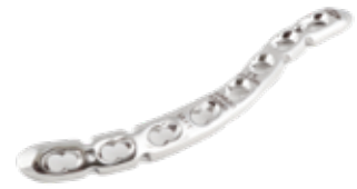
Placa Clavicula "S" Bloqueada