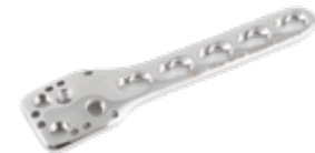
Placa Humeral Proximal Bloqueada