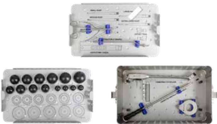
INSTRUMENTAL NO CEMENTADA (BIPOLAR)