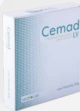
CEMAD- Cemento Óseo Radiopaco Vertebral LV